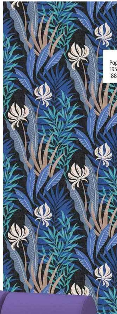
AQUATIQUE Papier peint, Water Plant 1955, le-presse-papier.fr, 88 € le lè (62 x 300 cm).