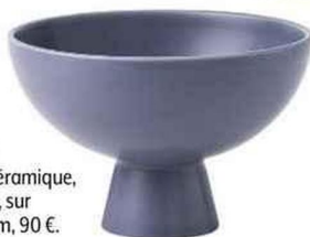
ÉPURÉE Coupe sur pied en céramique, Strøm, Raawii, sur madeindesign.com, 90 €.