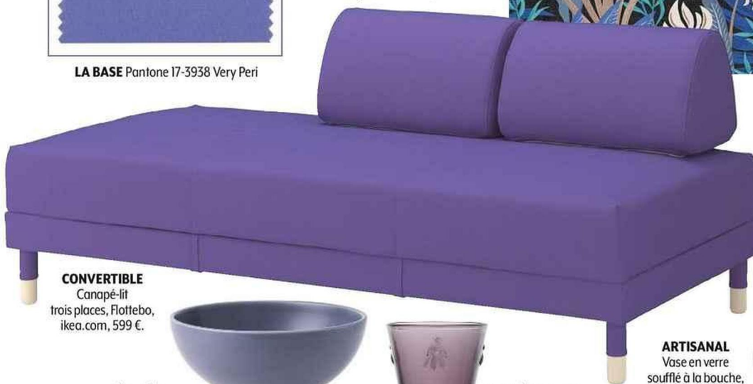
CONVERTIBLE Canapé-lit trois places, Flottebo, ikea.com, 599 €.