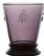
EMBLÉMATIQUE Verre à eau en verre, Abeilles, Côté Table, 8,90 €.