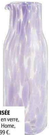
IRISÉE Carafe en verre, H&M Home, 19,99 €.