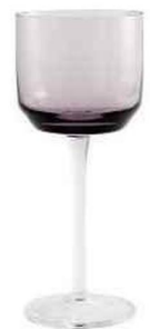
FUSÉLÉ Verre à eau ou à vin, Retro, Nordal, sur dyh.com, 52,80 € les 6.