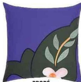
BRODÉ Coussin en satin et coton, K Horizon, Kenzo sur france.yvesdelorme.fr, 65 €.