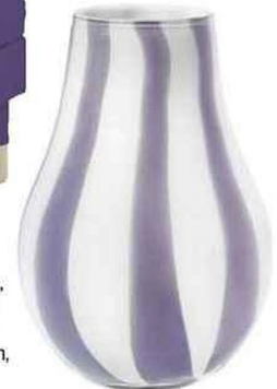
ARTISANAL Vase en verre soufflé à la bouche, Ada Stripe, Broste Copenhagen sur thecoolrepublic.com, 37,75 €.