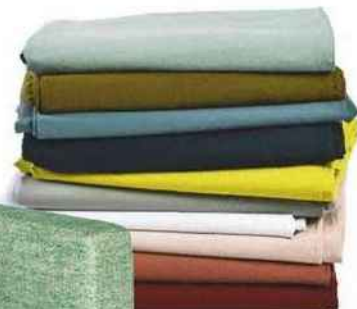
Pimpantes Housses de couette « Céleste », en percale de coton bio, à partir de 80 € en 200 x 140 cm, La Cerise sur le Gâteau.