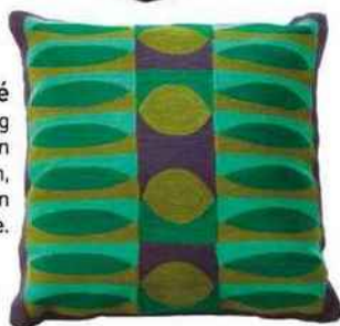
Brodé Coussin « Flying Green Peas », en coton, 45 x 45 cm, 55 €, Bensimon Concept Store.