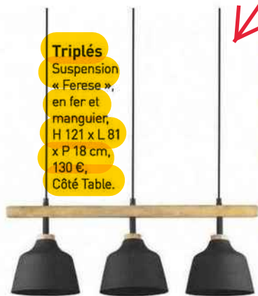
Triplés Suspension « Ferese », en fer et manguier, H 121 x L 81 x P 18 cm, 130 €, Côté Table.