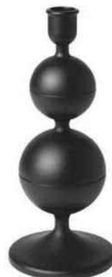
Boulier Bougeoir « Dekora », en aluminium, 24 cm, 9,99 €, Ikea.

À mi-chemin entre botanique et géométrie, ce tissu affiche un bel équilibre entre couleurs vives et profondes. Il appelle un décor tonique et moderne. « Grand Tilleul », en coton Oeko-tex, L. 140 cm, 41 € le mètre, Robert Le Héros x Maison Thevenon.