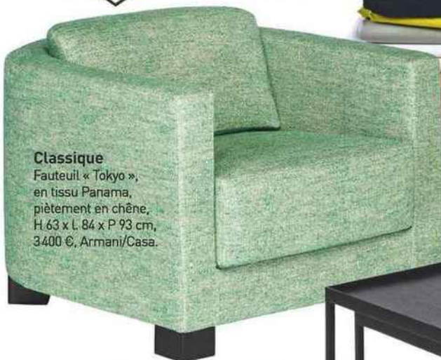
Classique Fauteuil « Tokyo », en tissu Panama, piètement en chêne, H 63 x L 84 x P 93 cm, 3400 €, Armani/Casa.